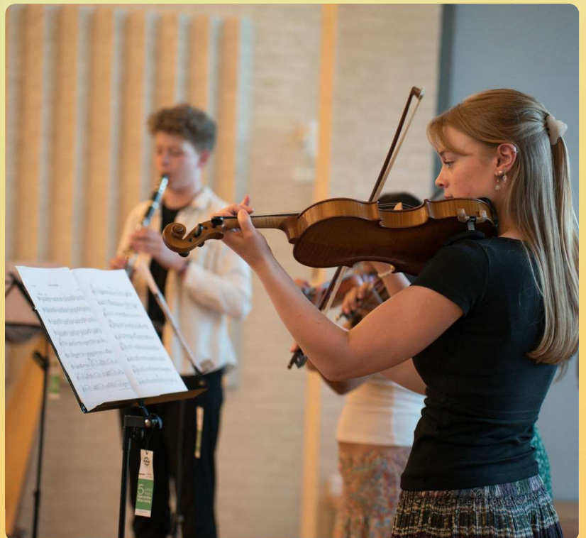
Klassisk koncert i Klosterkirken