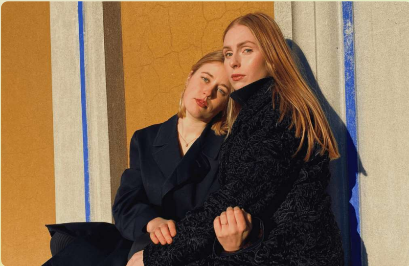
Stabat Mater i Nordre Kirke