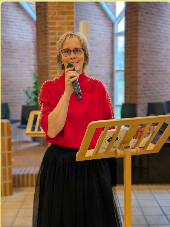
Cafékoncert i Lindeskovkirken